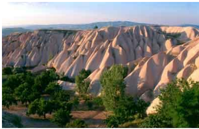
- CAPPADOCE -