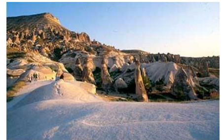
- CAPPADOCE -

Départ en direction d'Antalya. Sur la route, arrêt pour la visite du caravansérail d'Obrukhan, de type seldjoukide. Déjeuner en cours de route. Dîner et nuit dans la région d'Antalya.