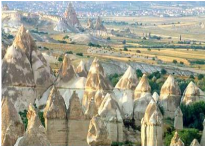
Cappadoce - Vallée de Pasabag