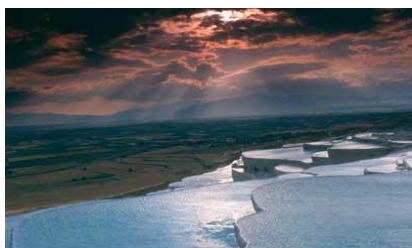
- PAMUKKALE -

Départ pour la ville sainte de Konya, aux très beaux monuments seldjoukides et religieux. Visite du Musée de Mevlana, fondateur de l'ordre des Derviches Tourneurs et de la mosquée de Selimiye. Déjeuner et continuation vers la Cappadoce. Dîner et nuit.