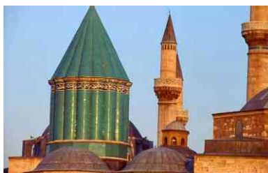
- KONYA -