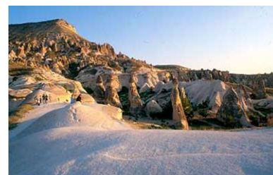
- CAPPADOCE -