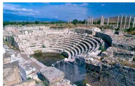
- APHRODISIAS -

Départ vers Aphrodisias et visite du site antique, l'un des complexes les mieux conservés du monde romain avec son stade, son théâtre et son odéon. Déjeuner et continuation vers Pamukkale. Visite du "Château de Coton", site naturel remarquable avec ses gigantesques vasques blanches de calcaire, alimentées par des sources d'eau chaude, et de la nécropole de Hiérapolis. Dîner et nuit à Pamukkale ou Denizli.