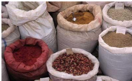
- EPICES -

Petit déjeuner puis transfert à l'aéroport de TUNIS. Envol à destination de FRANCE.