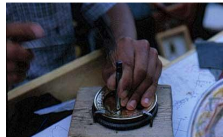
- ARTISANAT -

27B de l'Hôtel de Ville - 69550 AMPLEPUIS